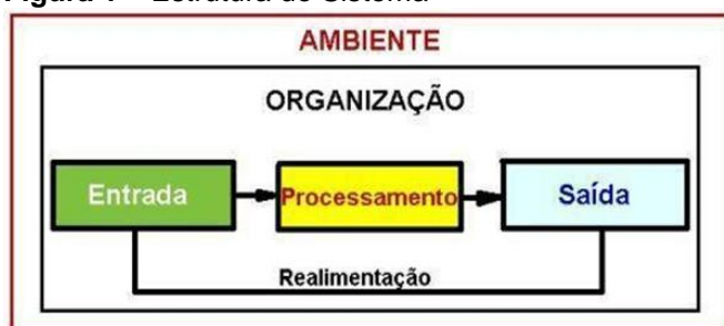
Figura 1 – Estrutura de Sistema