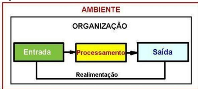
Figura 1 – Estrutura de Sistema